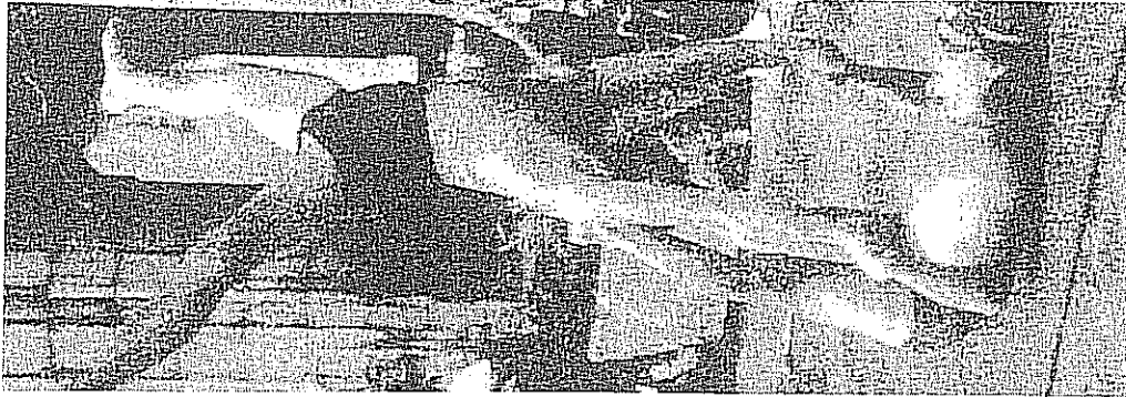
Le festival Scènes en Valois propose de nombreux spectacles : cirque, acrobates, chanteurs, et même marchands d'elixirs magiques.